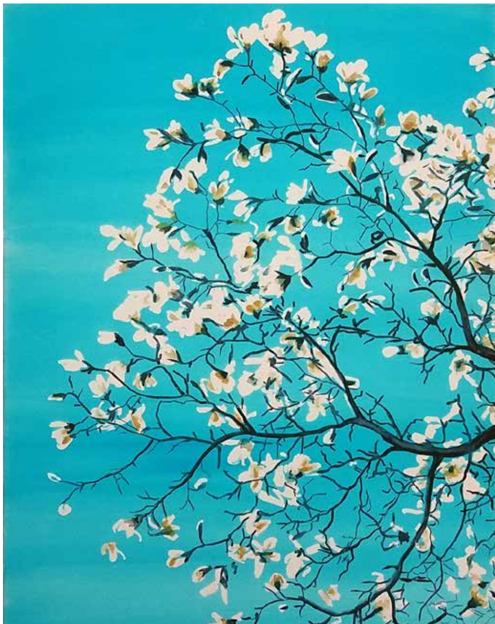
Tavaszi | 70 × 50 cm | akvarell , vászon | 2018