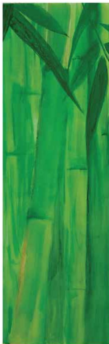
Bambusz 1-3 | 3db. 20 × 40 cm | akvarell , vászon | 2018