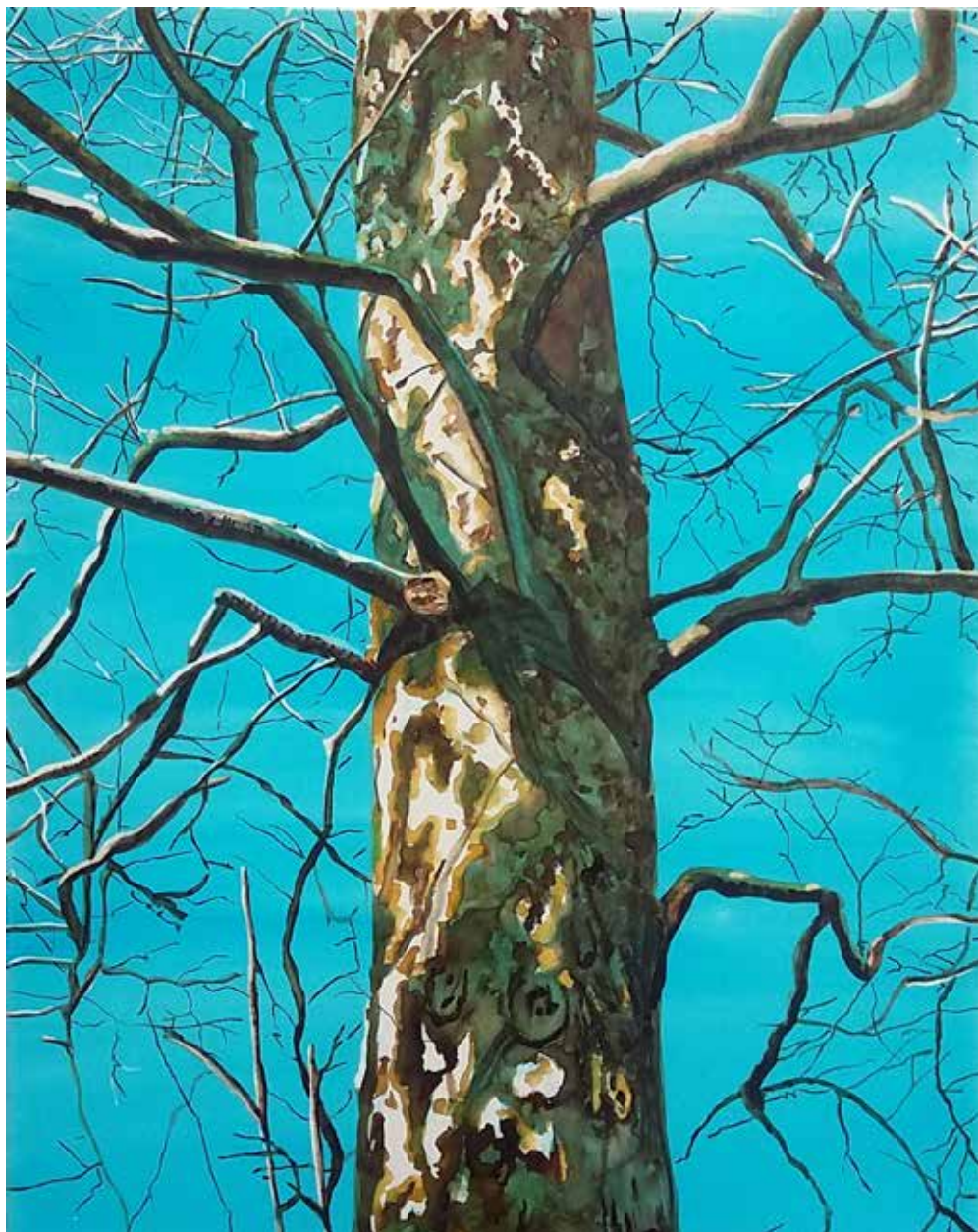
Platán 3 | 100 × 80 cm | akvarell , vászon | 2019