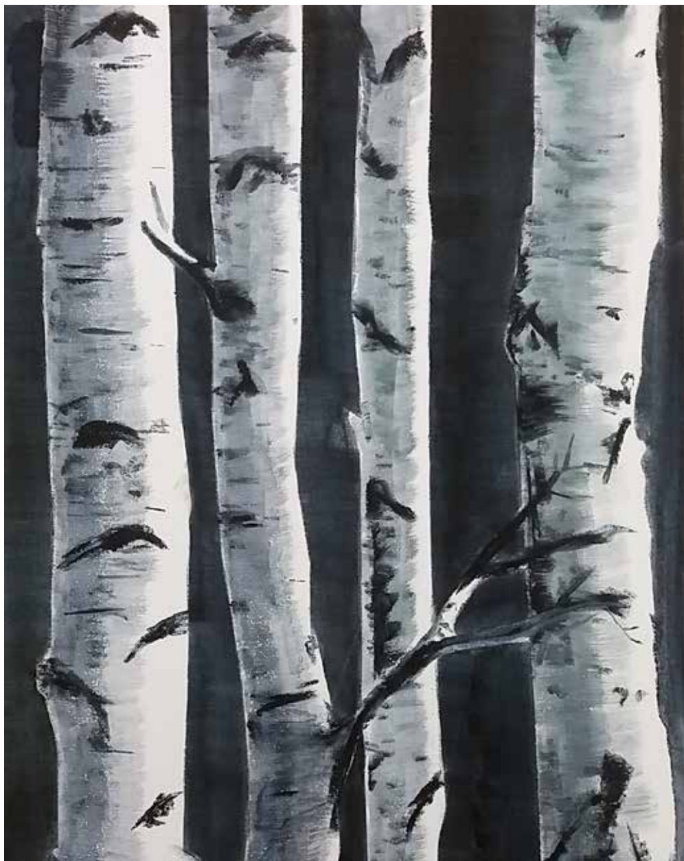
Nyírfaerdő | 70 × 50 cm | akvarell , vászon | 2018