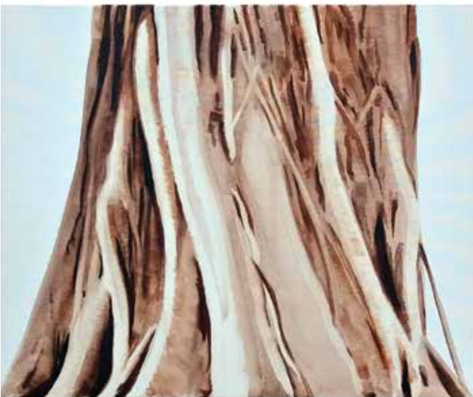
Indás I. | 2 db. 50 × 60 cm | akvarell , vászon | 2018