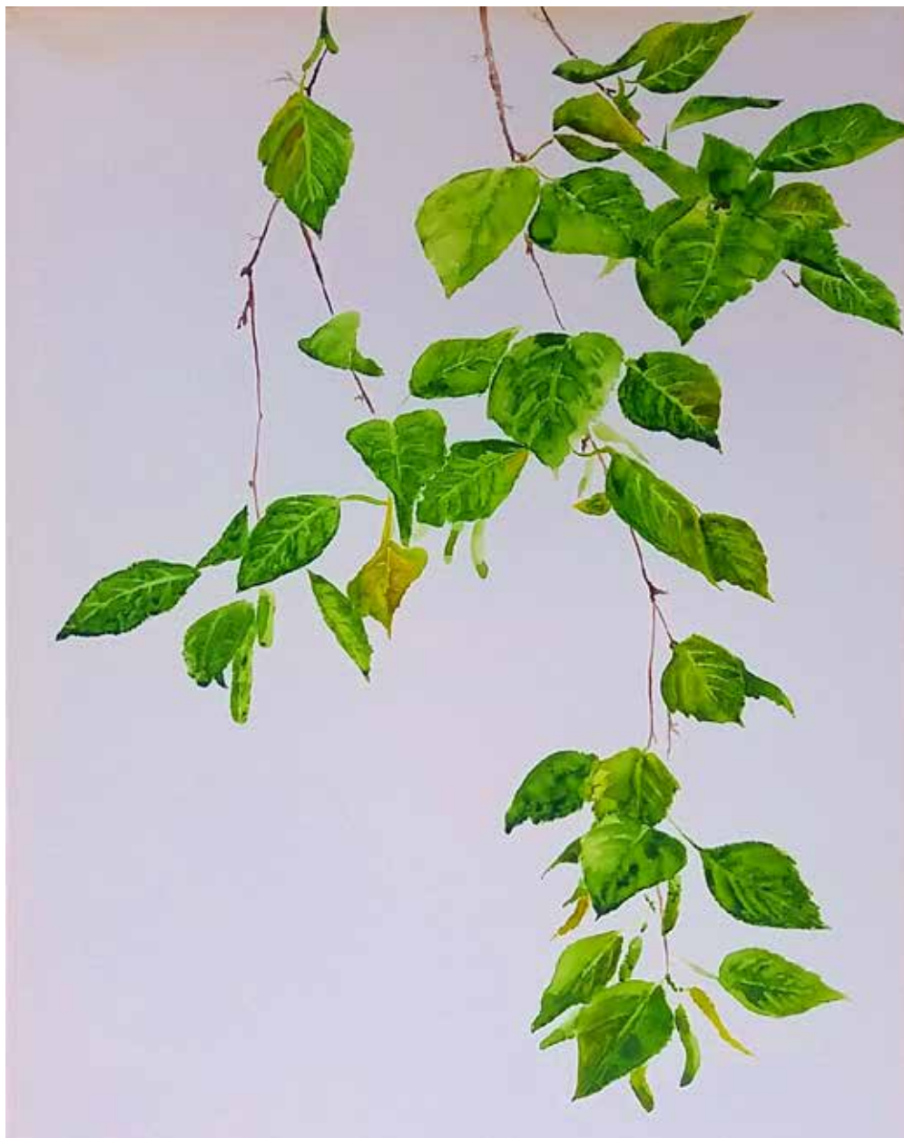
Nyírfalevelek 1 | 70 × 50 cm | akvarell , vászon | 2018