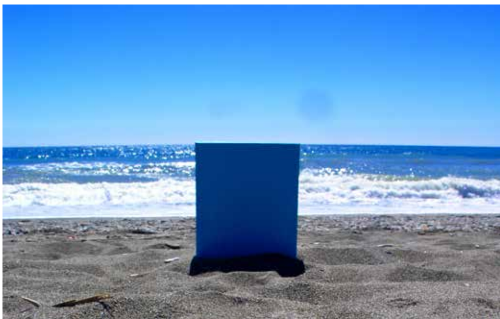
Kék lappal, Las Palmas • Gran Canaria • 2018, installáció