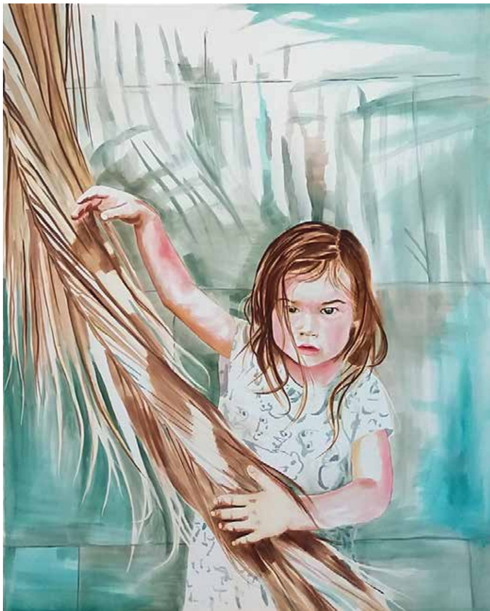
Pálmaág I. | 100 × 80 cm | akvarell , vászon | 2019