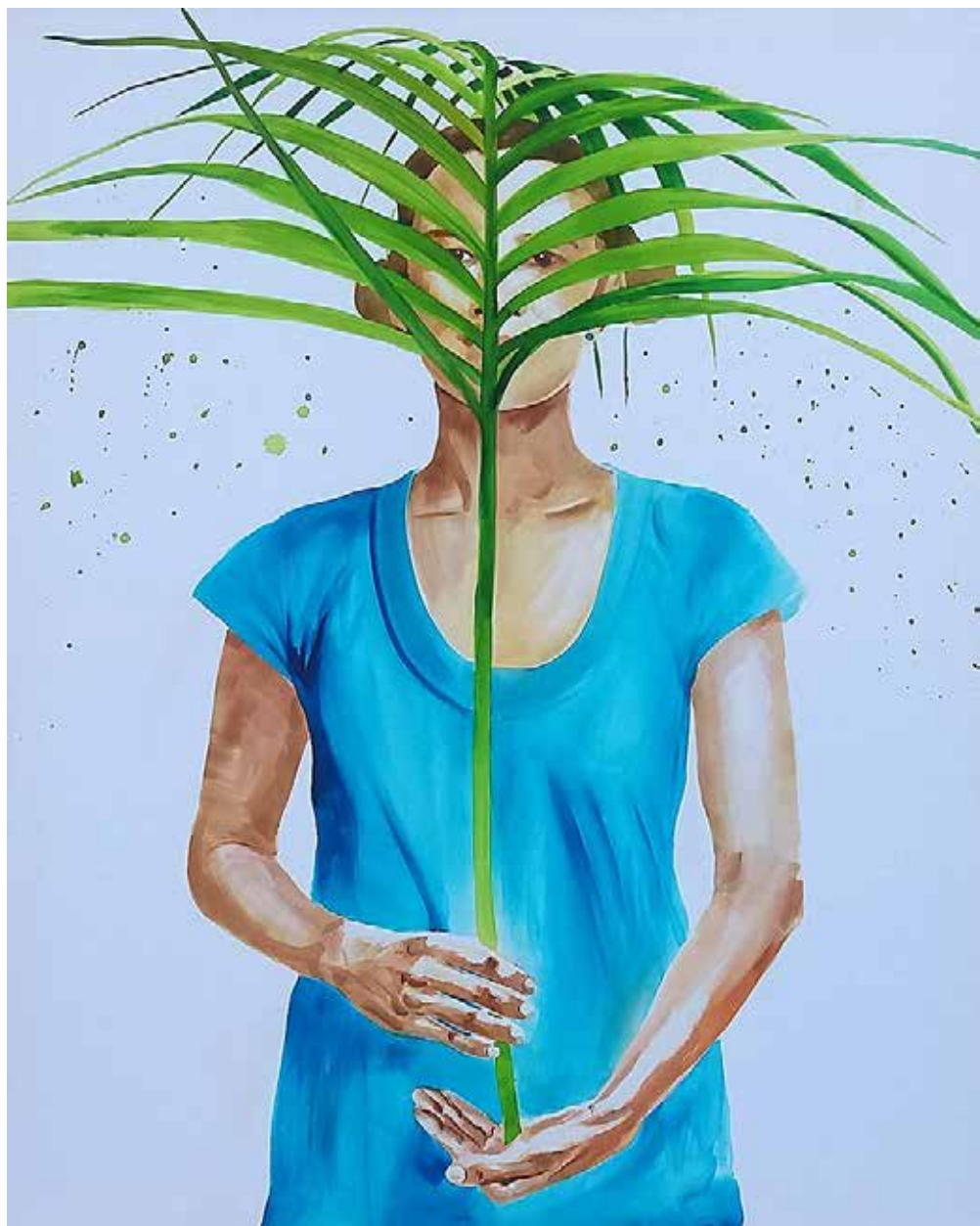
Ültet-ő | 100 × 80 cm | akvarell , vászon | 2019