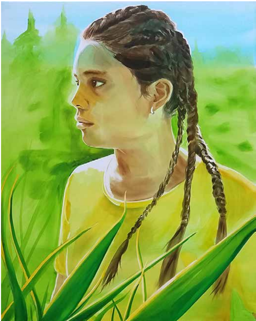
LUCA | 100 × 80 cm | akvarell , vászon | 2019